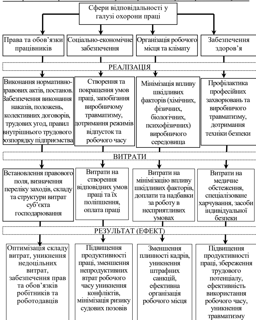
Рис. 1. Сфери відповідальності суб'єктів господарювання щодо охорони праці

Міжнародні нормативно-правові акти, нормативно-правові акти України, трудова угода, колективний договір та внутрішні нормативні акти підприємства визначають перелік заходів суб'єктів господарювання щодо охорони праці і, відповідно, визначають склад